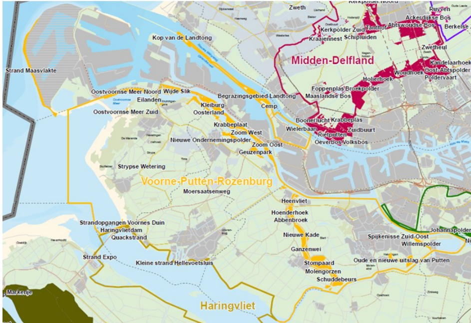
Figuur 2: beheergebieden en werkingsgebied VPR.

Aangemerkt dient te worden dat het schap ook enkele gebieden beheert waar geen overeenkomst voor is afgesloten en die niet in eigendom of erfpacht bij het schap zijn. In voorgaande tabel 2 (beheergebieden per deelnemer) zijn deze gebieden niet meegenomen. Op de volgende kaart zijn het werkingsgebied en de beheergebieden van VPR met oranje weergegeven. De meeste recreatiegebieden liggen binnen 1 gemeente, alleen het recreatiegebied Brielse Meer overschrijdt gemeentegrenzen en omvat stukken van de gemeenten Brielle, Westvoorne en Rotterdam.