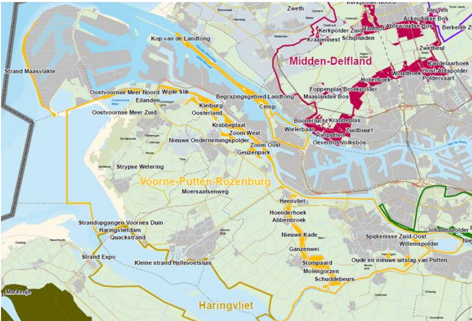
Figuur 2: beheergebieden en werkingsgebied VPR.

Aangemerkt dient te worden dat het schap ook enkele gebieden beheert waar geen overeenkomst voor is afgesloten en die niet in eigendom of erfpacht bij het schap zijn. Op de volgende kaart zijn het werkingsgebied en de beheergebieden van VPR met oranje weergegeven.