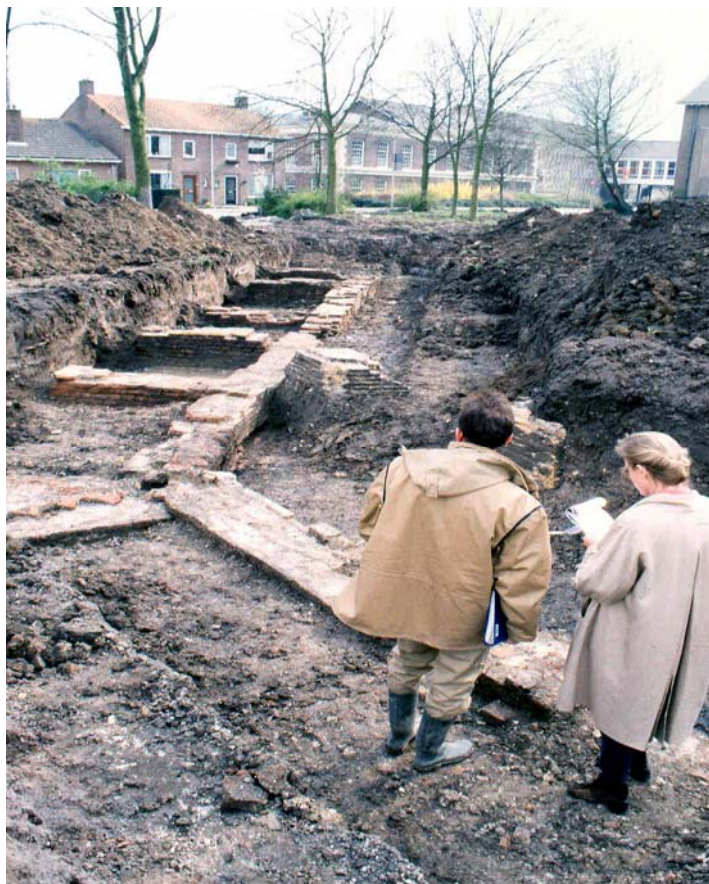
Archeologisch onderzoek in 1998 van de stadsmuur bij de Langestraat in Brielle