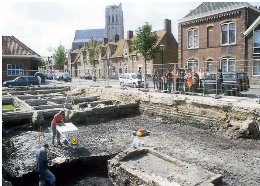
De opgraving aan de Coppelstockstraat – Langestraat in 2002