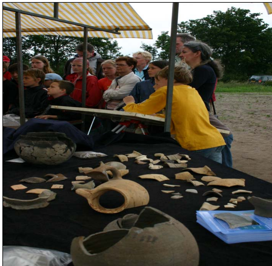
Open dagen bij archeologisch onderzoek trekken altijd veel belangstellenden

gemeente specifiek aandacht wil schenken en die aansluiten bij de identiteit van Brielle. Deze thema's kunnen worden gebruikt bij de citymarketing van Brielle. Archeologie kan, zelfs als het onzichtbaar onder de grond aanwezig is, beleefbaar worden gemaakt door middel van concrete producten als fiets- en wandelroutes, maar ook door het plaatsen van kunstobjecten die verwijzen naar het verhaal van het verleden langs deze routes. De resultaten van eventueel archeologisch onderzoek voorafgaand aan de ruimtelijke ontwikkeling kunnen worden gebruikt bij het ruimtelijk ontwerp of de landschappelijke inrichting, en op die manier meerwaarde verlenen aan de betreffende ontwikkeling. Dit wordt wel aangeduid met return on investment .