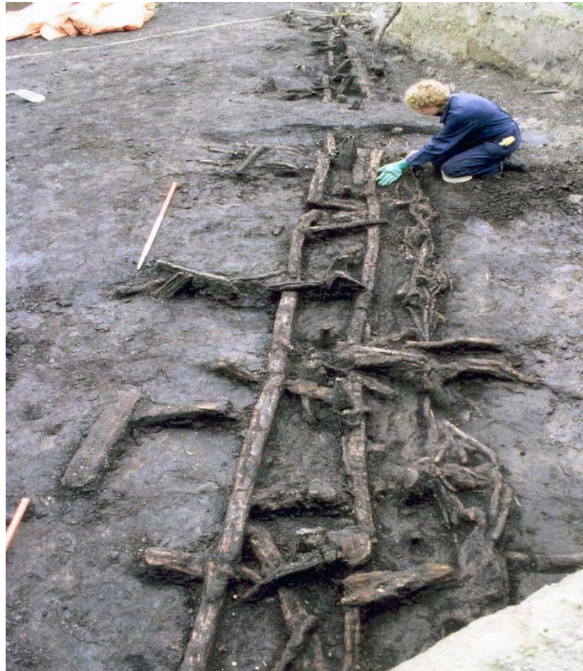
Het opgraven van de wand van een boerderij uit de Romeinse tijd tijdens de opgraving op het bedrijventerrein 'Seggelant' in 2000 te Brielle