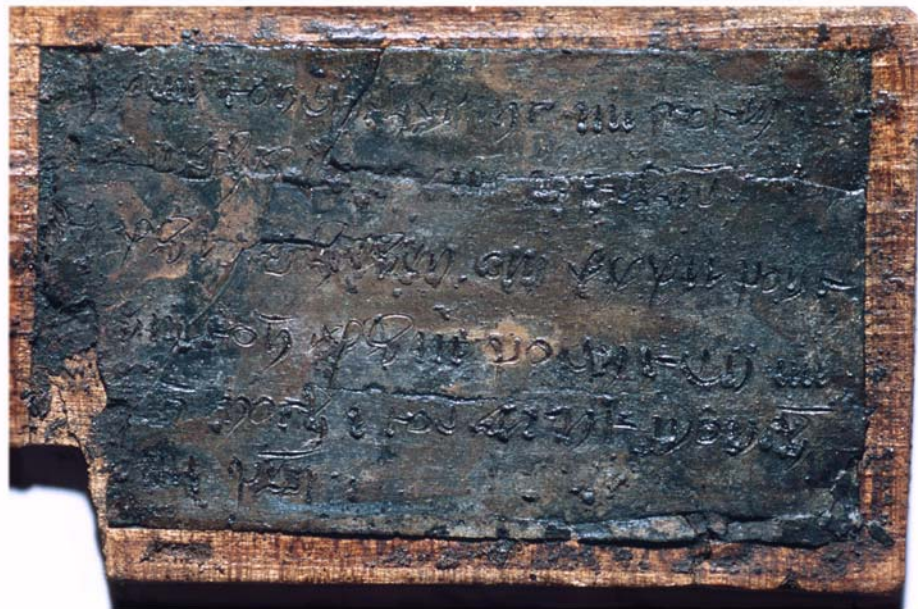
Wastafeltje uit de 15 e eeuw met notities, die betrekking hebben op de handel in haring, gevonden tijdens een opgraving in Brielle

In het plan dat voor u ligt, zijn alle maatschappelijke en archeologische aspecten opgenomen en tegen elkaar afgewogen. De gemeente Brielle heeft duidelijke uitgangspunten voor de omgang met haar bodemarchief vastgesteld. Dat is een flinke stap voorwaarts: voor een zorgvuldige omgang met het bodemarchief en voor de gemeente Brielle.